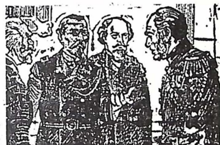
9 de novembro de 1889 - Benjamin Constant reúne seus companheiros, no Clube Militar, horas antes de realizar-se a Assembléia Geral

Benjamin intensifica o seu trabalho de proselitismo no meio militar, a partir de Outubro de 1889, e também junto a políticos e personalidades civis. Marca para o dia 9 de Novembro uma reunião, a portas fechadas, no Clube Militar, precisamente quando o Governo oferece, na Ilha Fiscal, uma recepção de gala, com centenas de convidados, em homenagem à oficialidade do navio de guerra chileno, Almirante Cockrane.