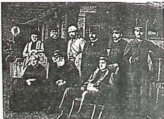
D. Pedro II, D. Tereza Cristina e o Conde D'Eu sentados, já a bordo do Alagoas momentos antes da partida para Lisboa, em 17 de novembro de 1889